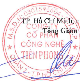
Lâm Thiệu Quân